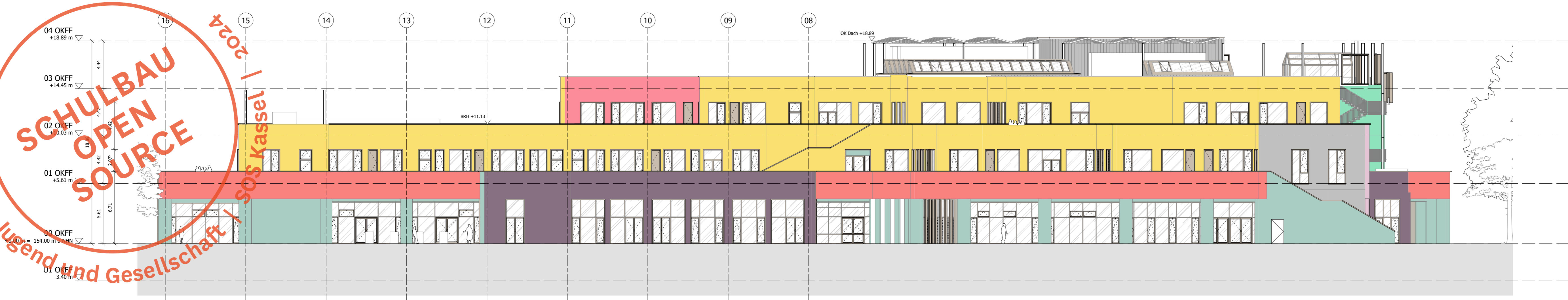
Ansicht Nord M 1:200