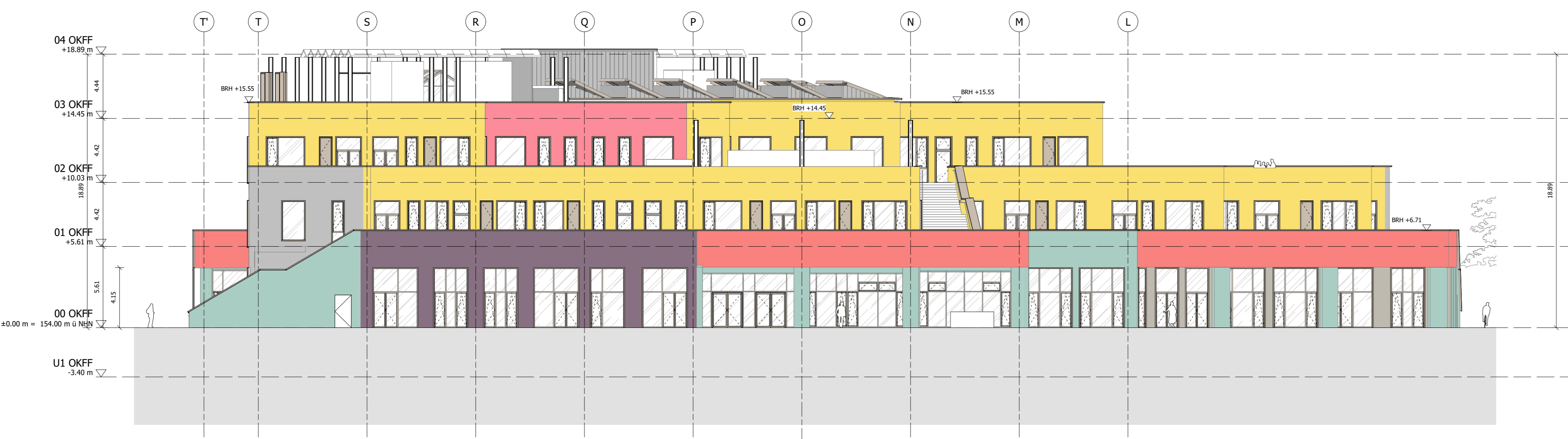
Ansicht Ost M 1:200