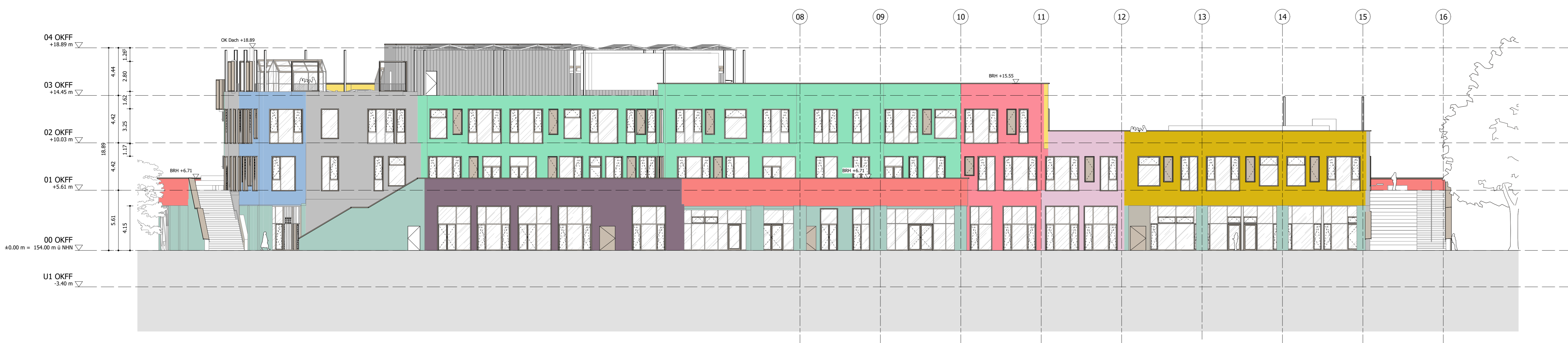
Ansicht Süd M 1:200