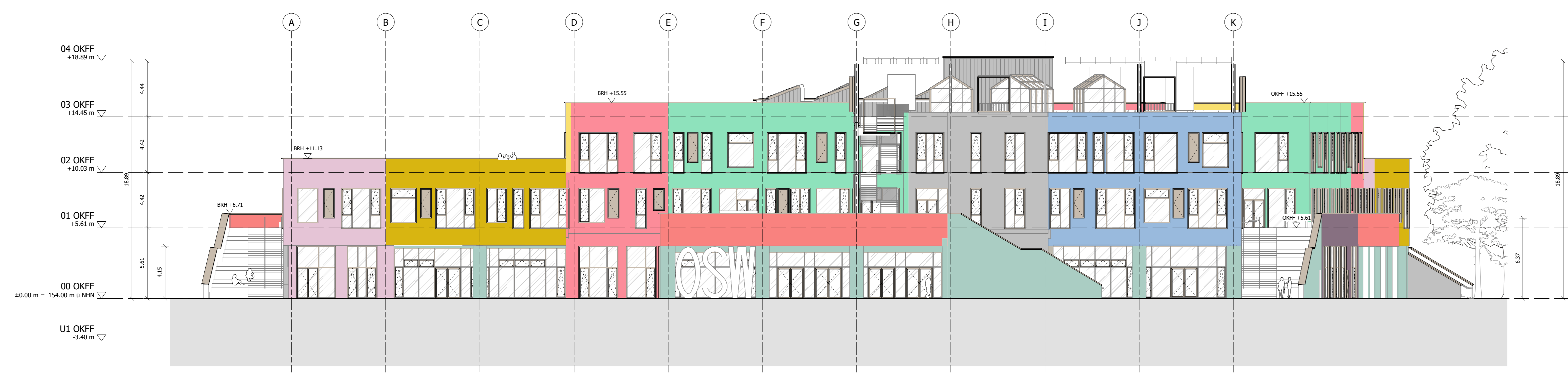
Ansicht West M 1:200