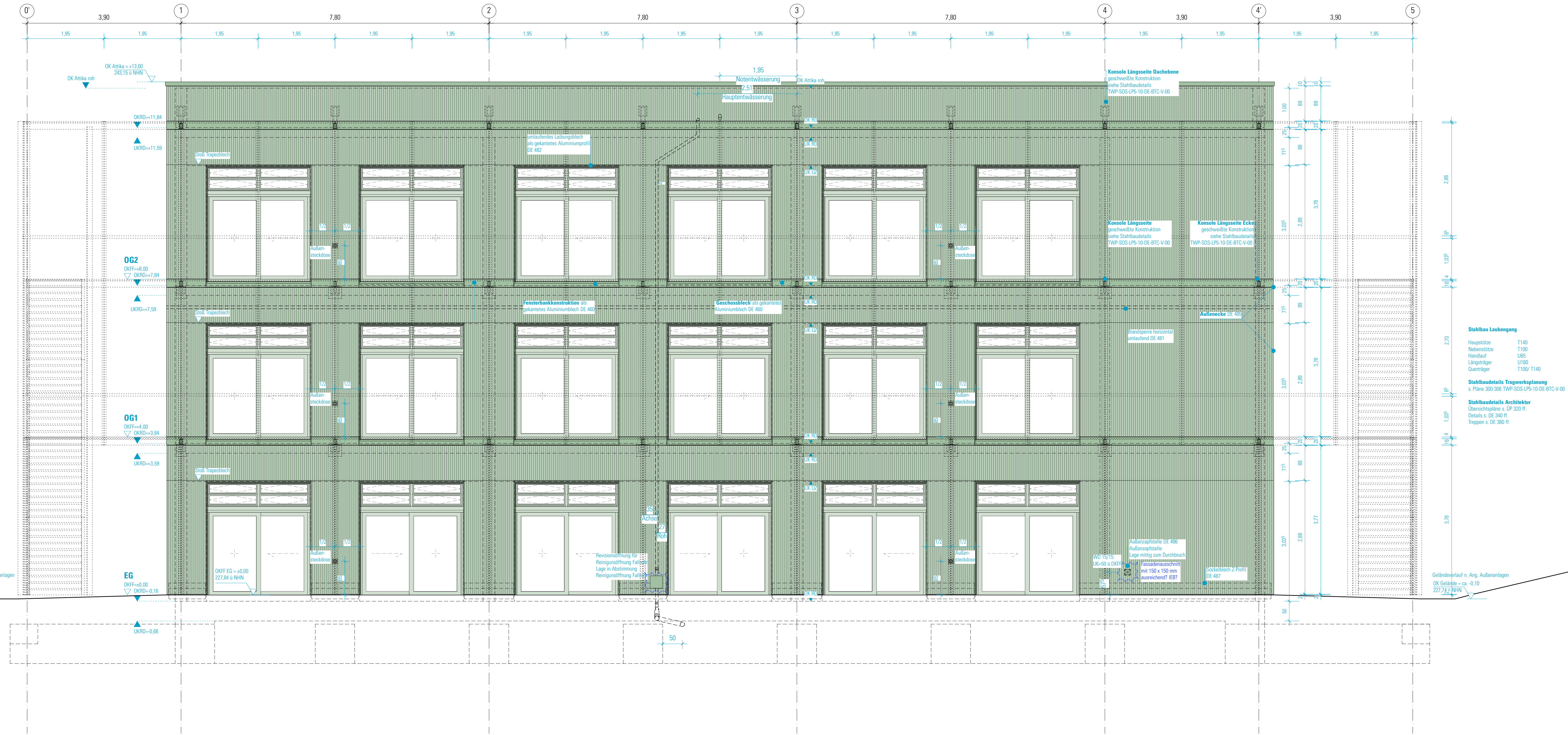
DARSTELLUNG ANSICHT OHNE PERGOLA + ELT-BOX